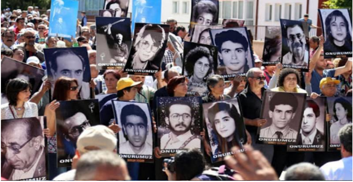
2 Temmuz 1993, Sivas'ta katledilenler

Bir de bunlardan ayrı tutacağım iki kişi var; oteldeki insanları yakmaya gelirken canlarından olanlar. Onlar da insan, ancak tıpkı dışarda bekleyen, ahlaktan ve insanlık duygusundan yoksun güruh gibi suçlular. 1993'ten beri SHP-DYP iktidarından bu yana birçok makamda farklı isimler yer aldı, değişen iktidarların süreci hakıyla yürüttükleri konusunda kamuoyuna gerekli güven verilemedi. Yargı bürokrasisi ve hâkimler nezdinde farklı grupların egemen olduğu haberleştirildi, hiçbir dönemde yargılamanın adilane yürütüldüğüne dair kamuoyunda olumlu bir kanaat oluşmadı. En önemli faillerden Cafer Erçakmak'ın, olaydan 20-25 sene sonra - bütün bu yıllardır hakkında yakalama kararı olduğu halde (!) - tüm süreç boyunca Sivas'ta yaşamaya devam ettiği ancak öldüğünde ve defni sırasında ortaya çıktı. Davanın zaman aşımını engellemek, Madımak'ı müze yapmak ve 33 CANI anmak üzere düzenlenmek istenen törenlerin ilgili makamlarca yasaklanmasıyla 29 yıldan beri kamuoyunda yaratılan güvensizlik pekiştiriliyor.